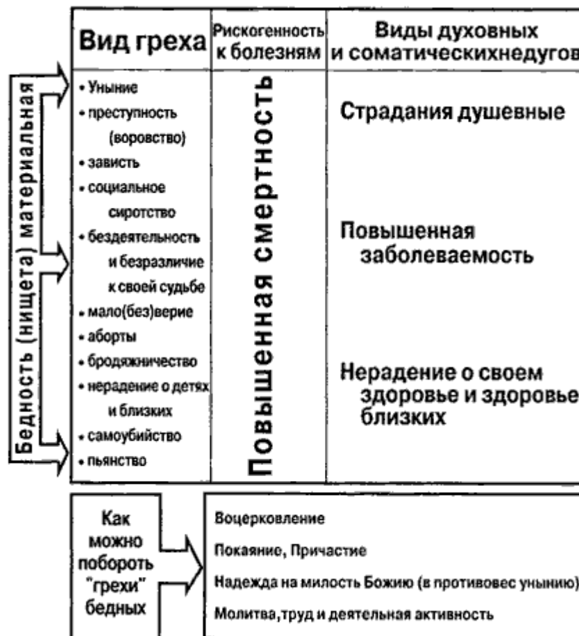
Схема 3. "Бедность не порок", но становится пороком при греховном образе жизни

Мы специально довольно пространно остановились на грехе гордости и вытекающих из него других грехов, чтобы показать на примере всего общества, государства, какое важное значение в судьбе не только одного человека, но и всего государства они имеют. И в этом нам помогли не только священное Писание, писания святых отцов, но и последние данные научных исследований.