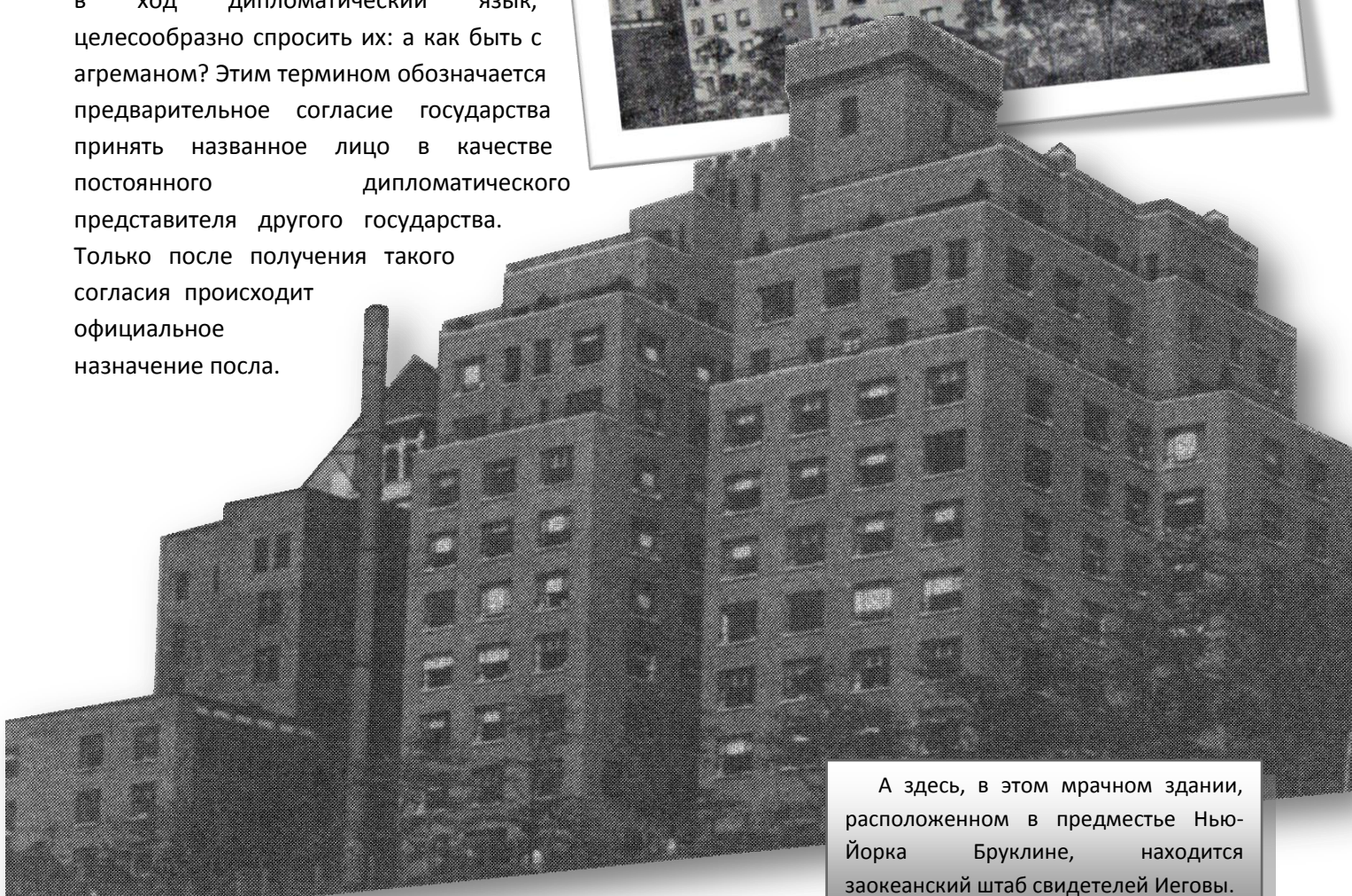
А здесь, в этом мрачном здании, расположенном в предместье Нью-Йорка Бруклине, находится заокеанский штаб свидетелей Иеговы.