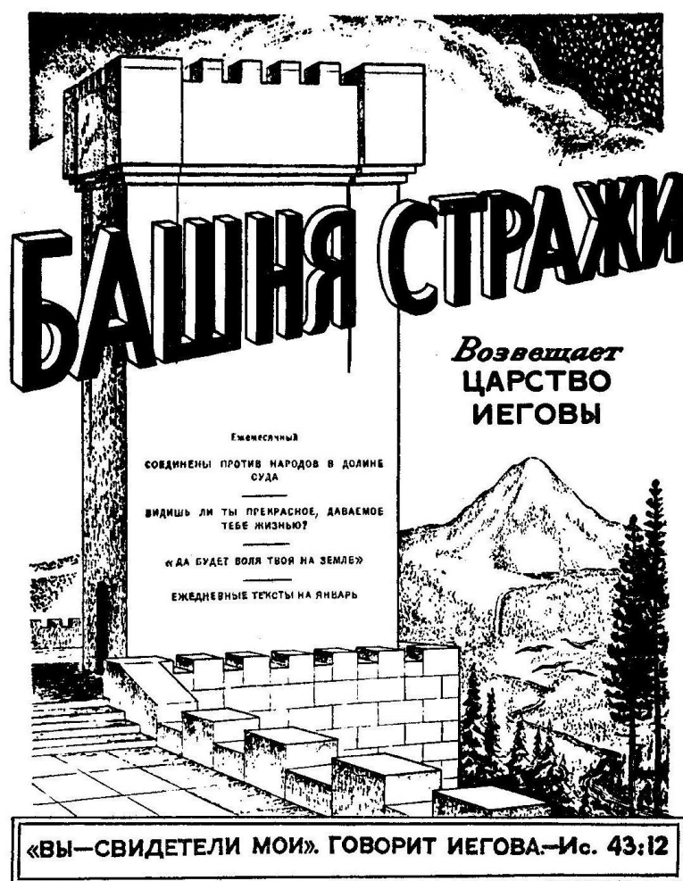
Обложка журнала «Башня стражи» - официального органа «Общества свидетелей Иеговы».

В 1919 году Рутерфорд выпустил в свет брошюру «Вавилон пал». В ней все религии, в том числе и христианство, были объявлены выдумкой сатаны для отвлечения людей от подлинного бога. В